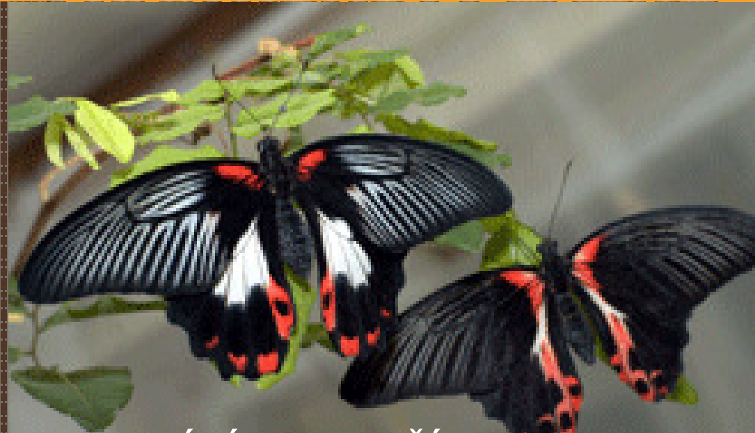
Obr.19 MOTÝLÍ FARMA ŽÍROVICE