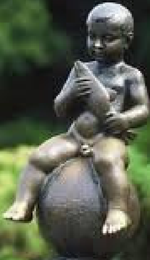
Obr. 18 SOŠKA FRANTIŠKA