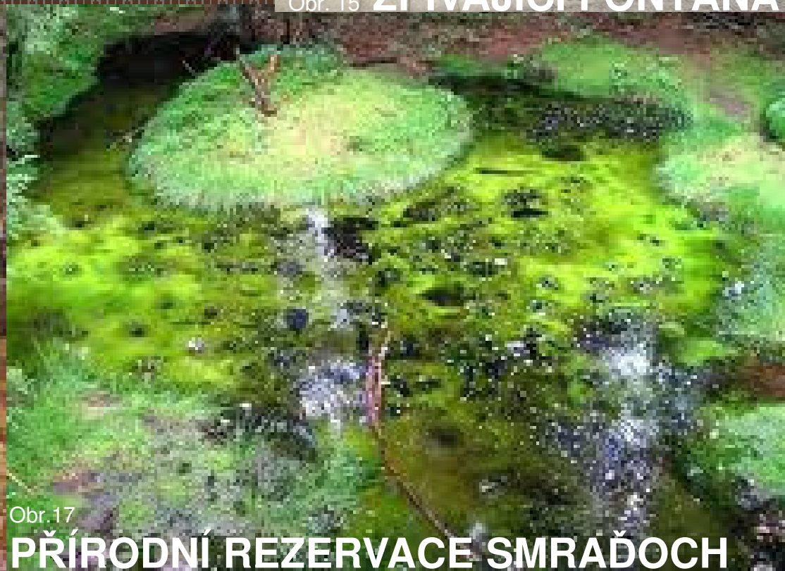
Obr. 17 PŘÍRODNÍ REZERVACE SMRAĎOCH