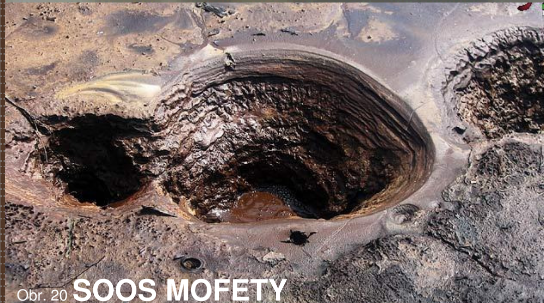
Obr. 20 SOOS MOFETY