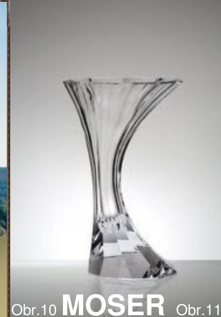
Obr.10 MOSER Obr.11