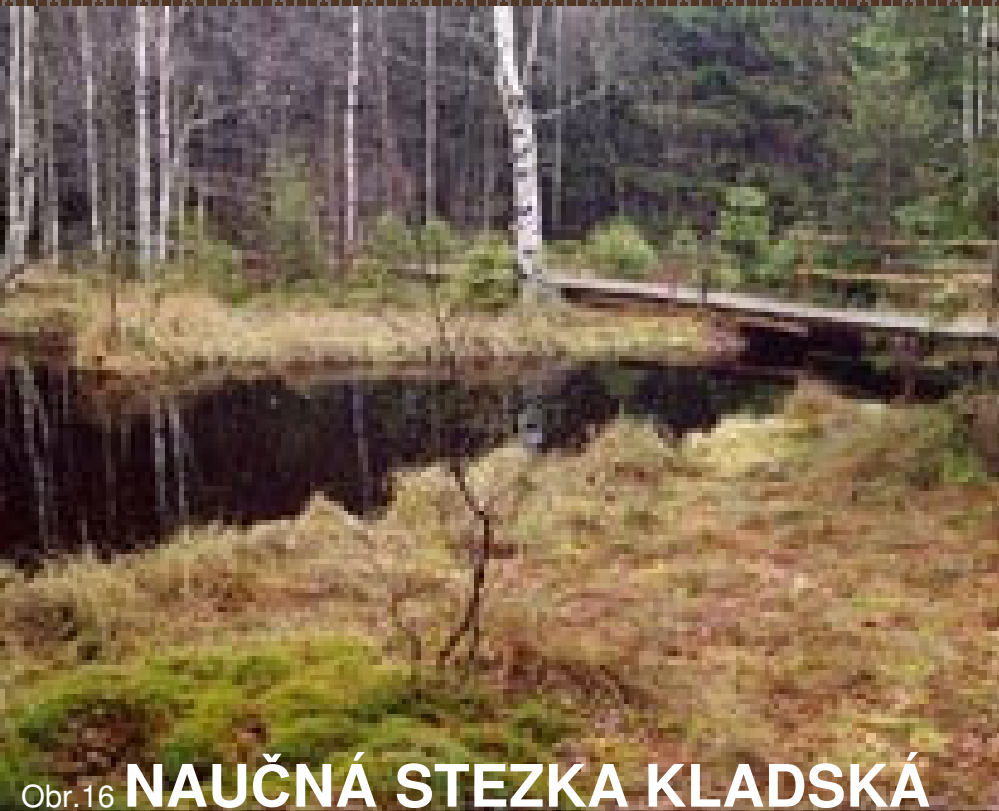
Obr. 16 NAUČNÁ STEZKA KLADSKÁ