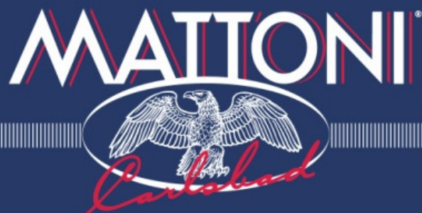
Obr.12 MINERÁLNÍ VODY KARLOVY VARY