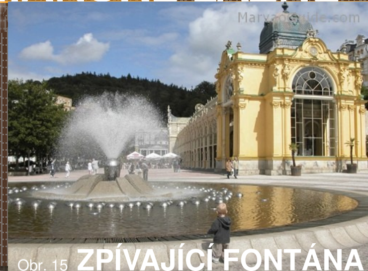
Obr. 15 ZPÍVAJÍCÍ FONTÁNA