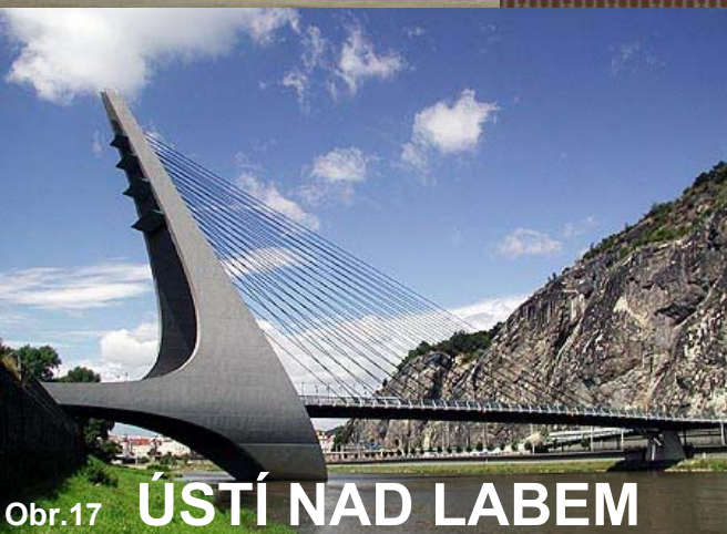
Obr.17 ÚSTÍ NAD LABEM