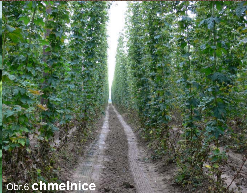
Obr. 6 chmelnice