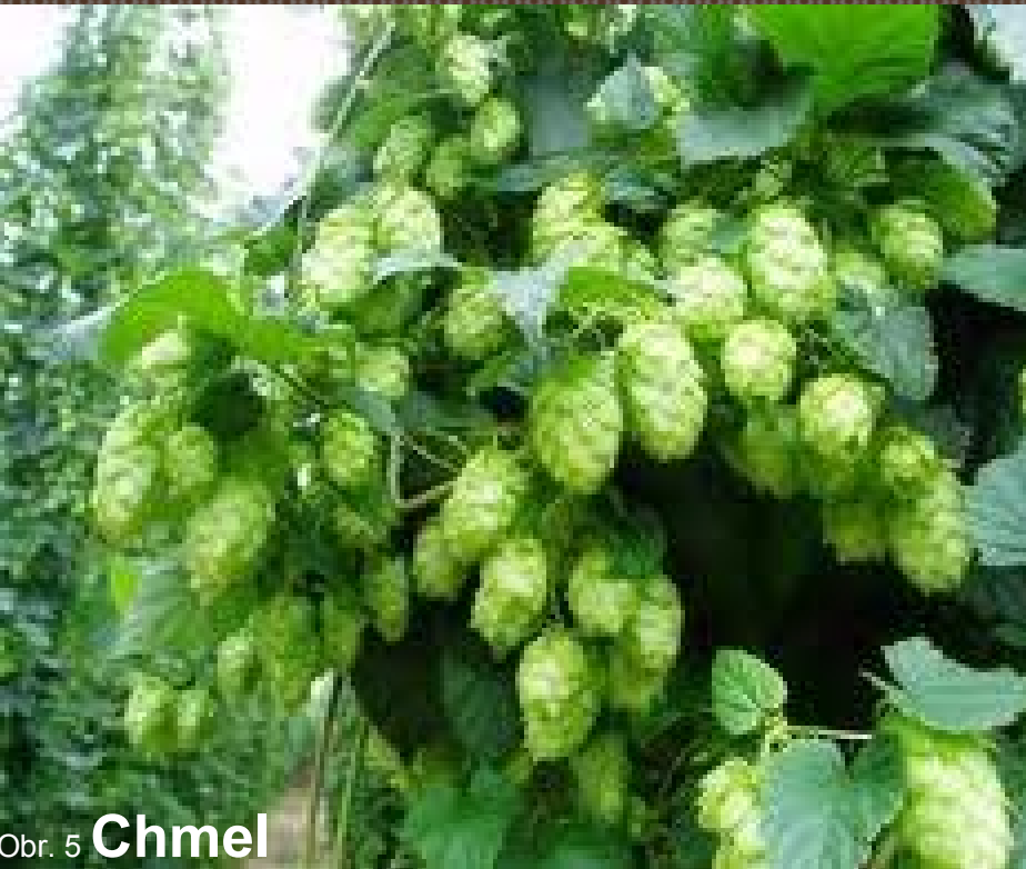
Obr. 5 Chmel

zemědělství: oblast Litoměřicka a Lounska - vinná réva, zelenina, ovoce, chmel