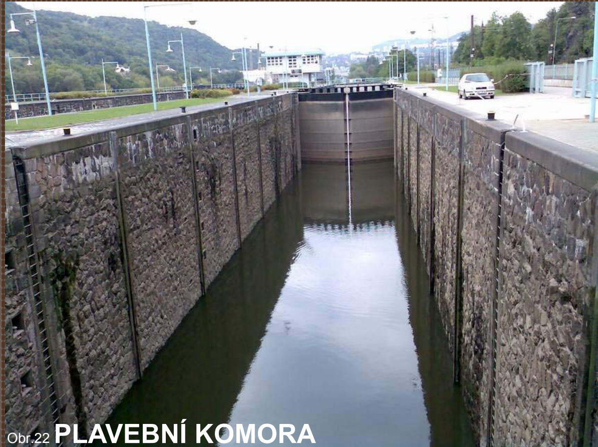
Obr.22 PLAVEBNÍ KOMORA

je objekt na vodním toku, který slouží ke zvýšení vodní hladiny a převezení plavidel Součástí bývá plavební komora, elektrárna, rybovod a další.