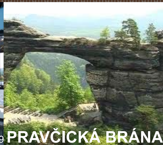
obr.19 PRAVČICKÁ BRÁNA