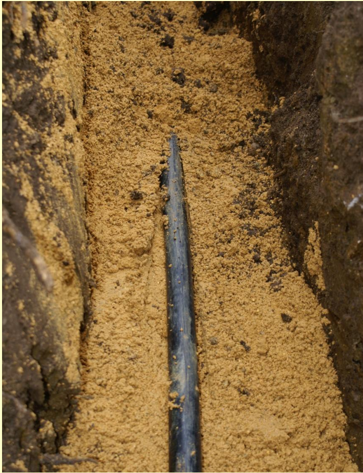
Kabel položený na pískové vrstvě o tl. 8 cm