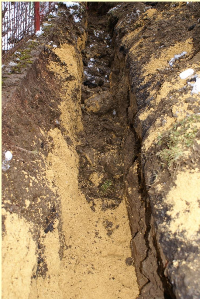
Zához zeminou pod výstražnou folií