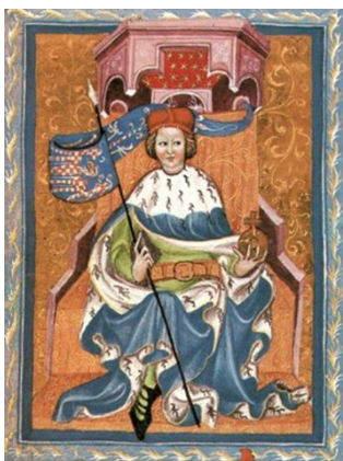
Přemysl Otakar II.