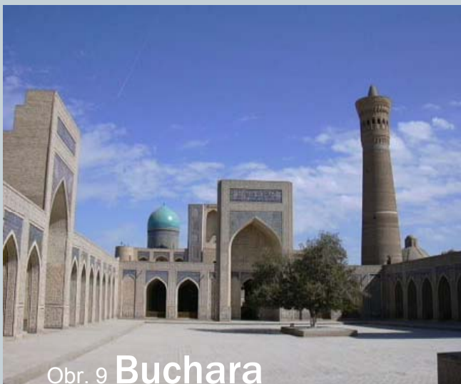
Obr. 9 Buchara