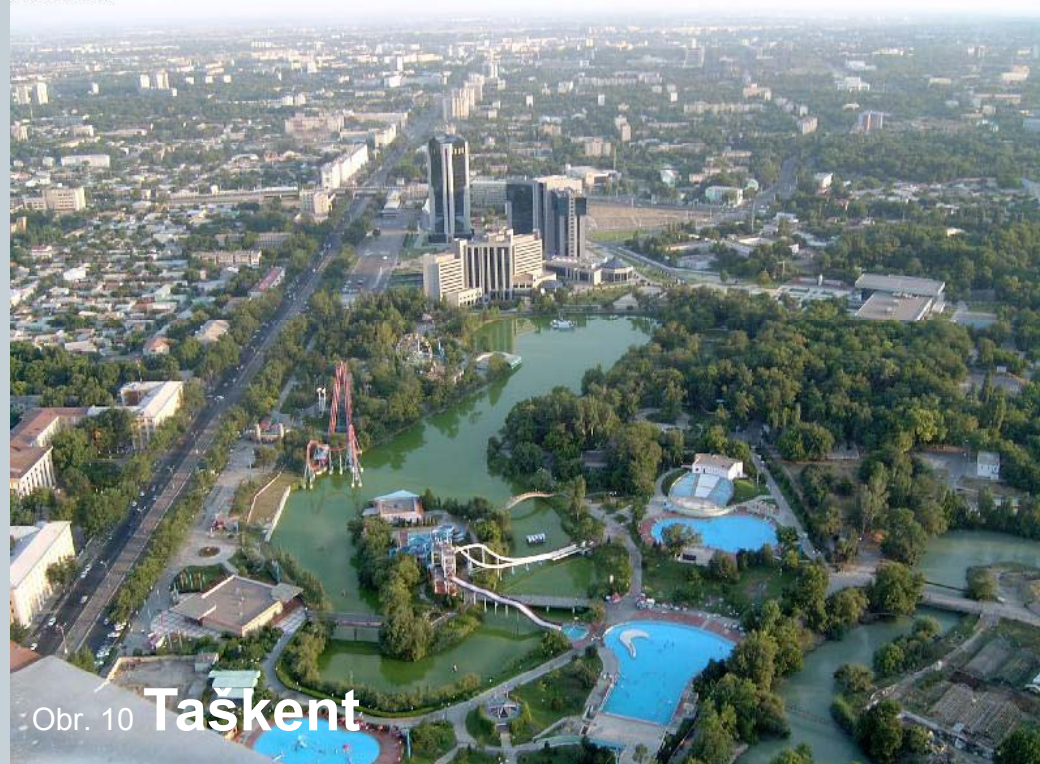
Obr. 10 Taškent