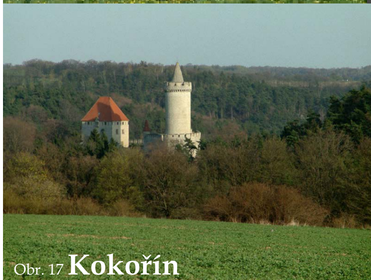
Obr. 17 Kokořín