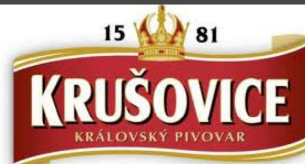
Obr. 13 Pivo Krušovice