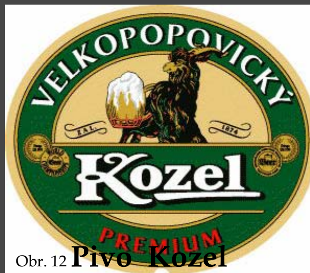
Obr. 12 Pivo Kozel