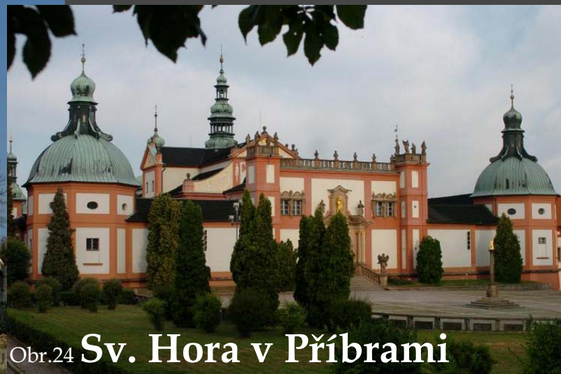
Obr.24 Sv. Hora v Příbrami

47. Kmochův Kolín festival dechových orchestrů