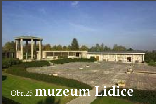
Obr.25 muzeum Lidice