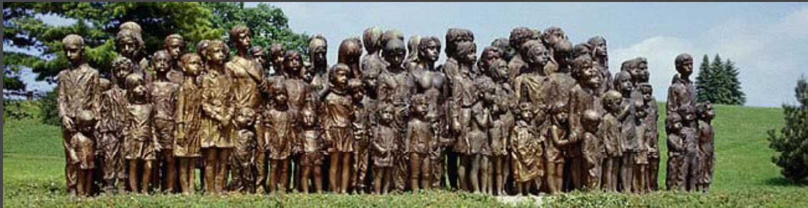
Obr.26 Památník Lidické děti

"Vracím ve jménu míru 82 Děti Národa na jejich rodnou pláň jako varující symbol miliónů zavražděných dětí v nesmyslných válkách lidstva.