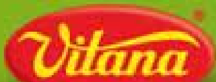
Obr.10 Závod Vitana