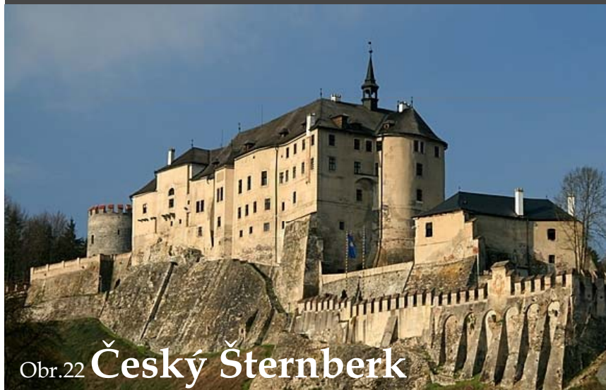
Obr.22 Český Šternberk