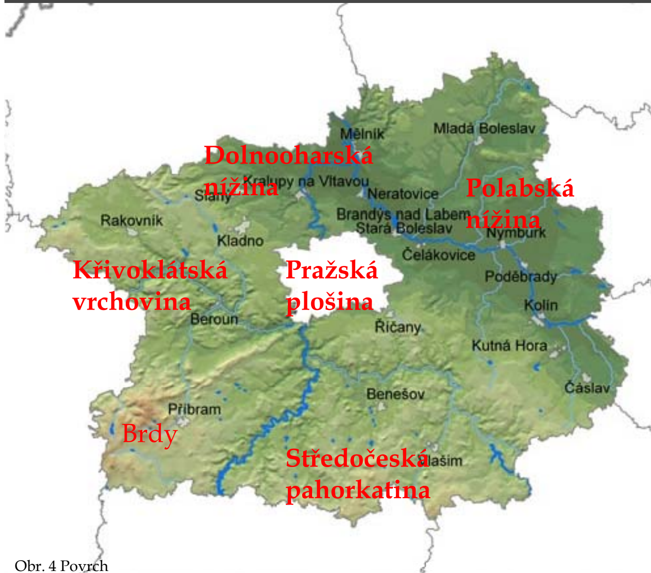
Obr. 4 Povrch

Polabská nížina Dolnooharská nížina Brdy Středočeská pahorkatina Pražská plošina Křivoklátská vrchovina