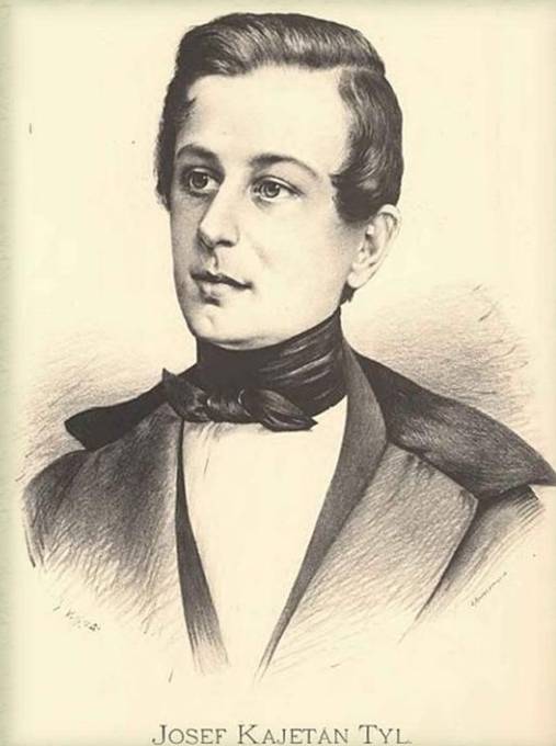
JOSEF KAJETAN TYL