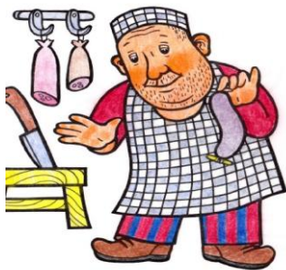
řezník Pracuje na jatkách a v řeznictví.