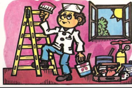
malíř pokojů Pracuje v místnosti.