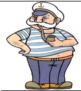
námorník Pracuje na lodi.