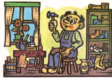
švec Pracuje v obuvnické dílně nebo v továrně na boty.