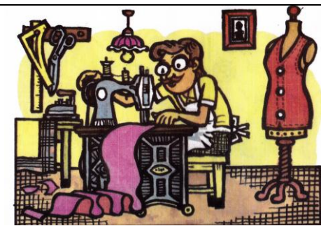
krejčí Pracuje v krejčovské dílně.