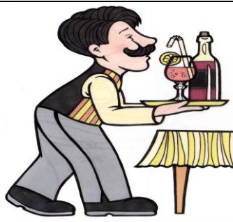
číšník Pracuje v restauraci