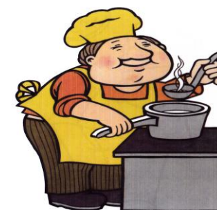
kuchař Pracuje v kuchyni.