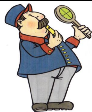
výpravčí Pracuje na nádraží.