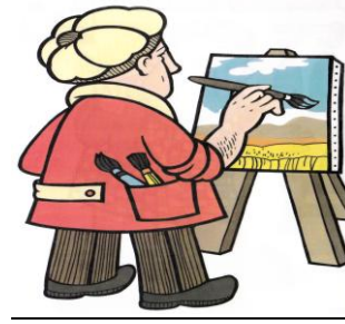
malíř Pracuje hlavně v ateliéru, ale také v terénu.