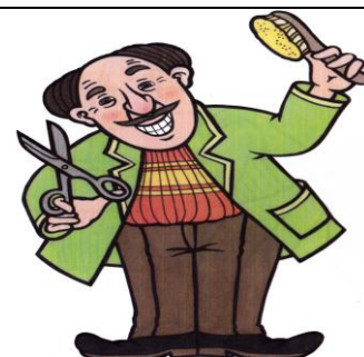
holič Pracuje v kaděrnictví.