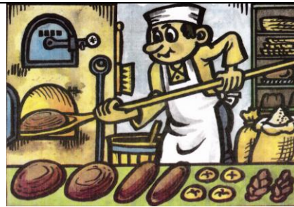
pekař Pracuje v pekárně.