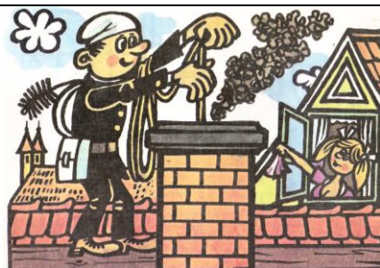
komíník Pracuje na střeše.