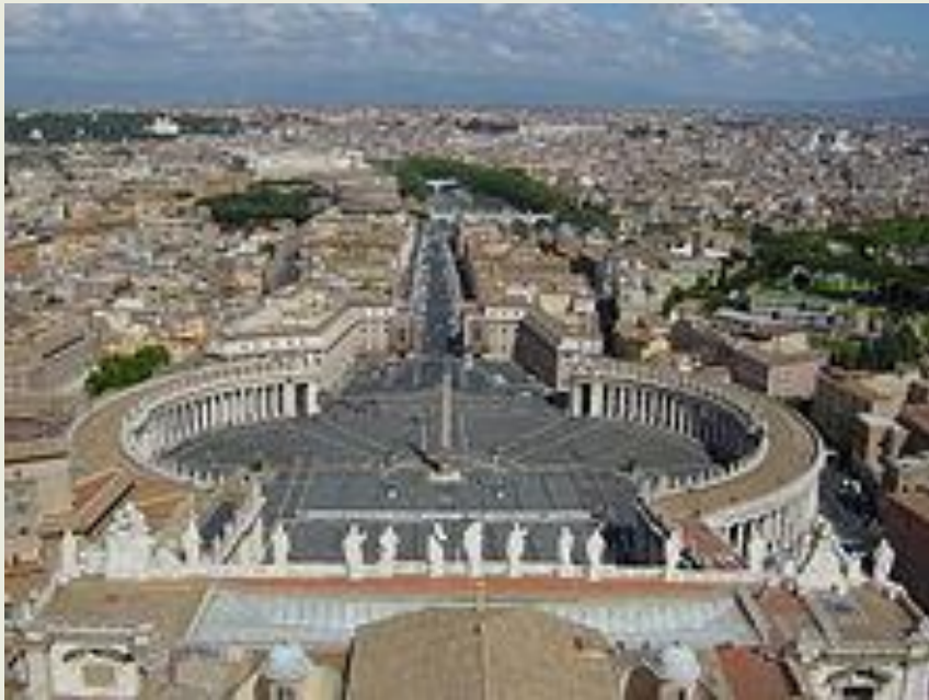
POHLED NA ŘÍM Z BAZILIKY SV. PETRA