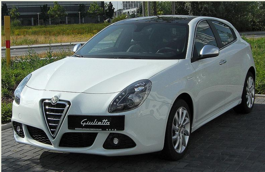
ALFA ROMEO GIULIETTA