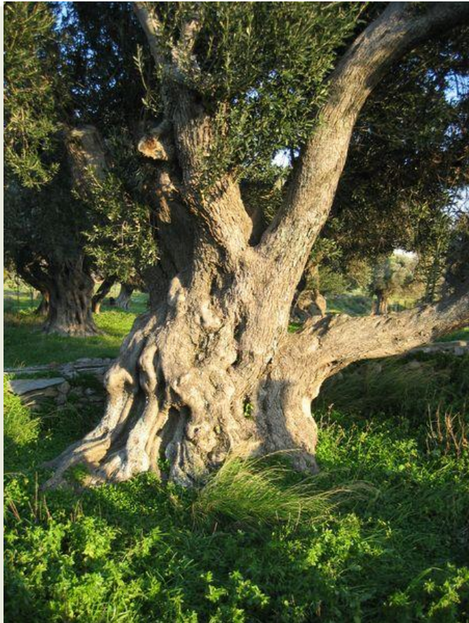
STARÝ KMEN OLIVOVNÍKU EVROPSKÉHO