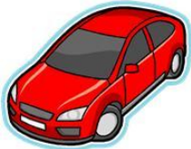
one red car