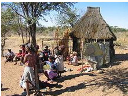
Křovácká chatrč, Namibie, 2005

Sanové jsou tradičně rovnostářská společnost. Status velitele se dědí, autorita náčelníků je však omezena a Křováci se místo toho rozhodují mezi sebou na základě dohody.