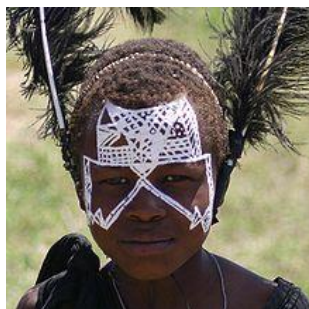
Masajský chlapec čekající na svůj obřad obřizky