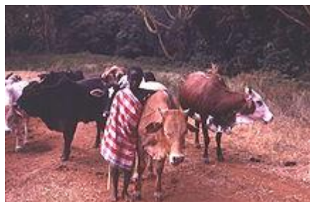
Masajské bohatství - dobytek

Masajové jsou africká černošská etnická skupina nilotského původu. Po dlouhém stěhování v minulosti se Masajové usadili mezi Kilimandžárem a horou Mount Keňa (Blízko nebe) tedy v dnešní severní Tanzánii a jihozápadní Keni. Počet Masajů je odhadován k 250 tisícům. Jejich pověst nespoutaných bojovníků a zachování si původního způsobu života je v dnešním moderním světě obdivuhodná. Mluví jazykem Maa, což je Nilo-Saharská jazyková skupina. U Masajů stále vládne patriarchální charakter.