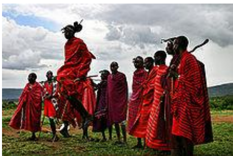
Červená kostkovaná látka je typickým oděvem Masajů i při rytmičných tancích