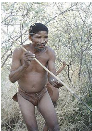
Křovák z Botswany

Křováci (San, Sho, Basarwa, Kung nebo Khwe) jsou původní obyvatelé jižní Afriky, osídlují většinu oblastí Zimbabwe, Lesotha, Mozambiku, Svazijska, Botswany, Namibie a Angoly.