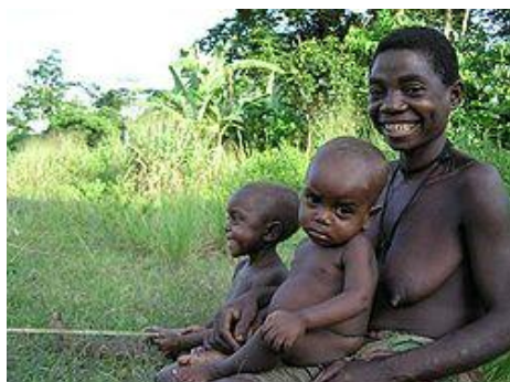
Rodina Pygmejů v africkém Kongu

Pygmejové je termín používaný pro různé etnické skupiny po celém světě, jejichž průměrná výška je neobvykle nízká. Antropologové definovali pojmem Pygmejové jakoukoli skupinu, jejíž dospělí jedinci nevyrostou do výšky více než 150 cm v průměru. Nejznámějšími Pygmeji jsou Aka, EFE a Mbuti ze střední Afriky. Pygmeje také nalezneme v Thajsku, Malajsii, Indonésii, na Filipínách, v Papui-Nové Guinei a v Brazílii. Částečně do tohoto pojmu můžeme zařadit i Negrity z jihovýchodní Asie. Na ostrovech Palau v Mikronésii byly nalezeny ostatky nejméně 25 miniaturních lidí staré přibližně 1000 až 3000 let, jenž můžeme také považovat za předky Pygmejů. [zdroj?] Jednotný termín pro všechny Pygmeje pocházející z Afriky neexistuje. Některé etnické skupiny jako např. Aka (Mbenga) , Baka , Mbuti a Twa používají pro označení Pygmej termín Bayaka, v množném čísle Aka/Yaka. Tento termín se používá nejčastěji ve Středoafričské republice. S termínem Bambenga se můžeme setkat v Kongu.