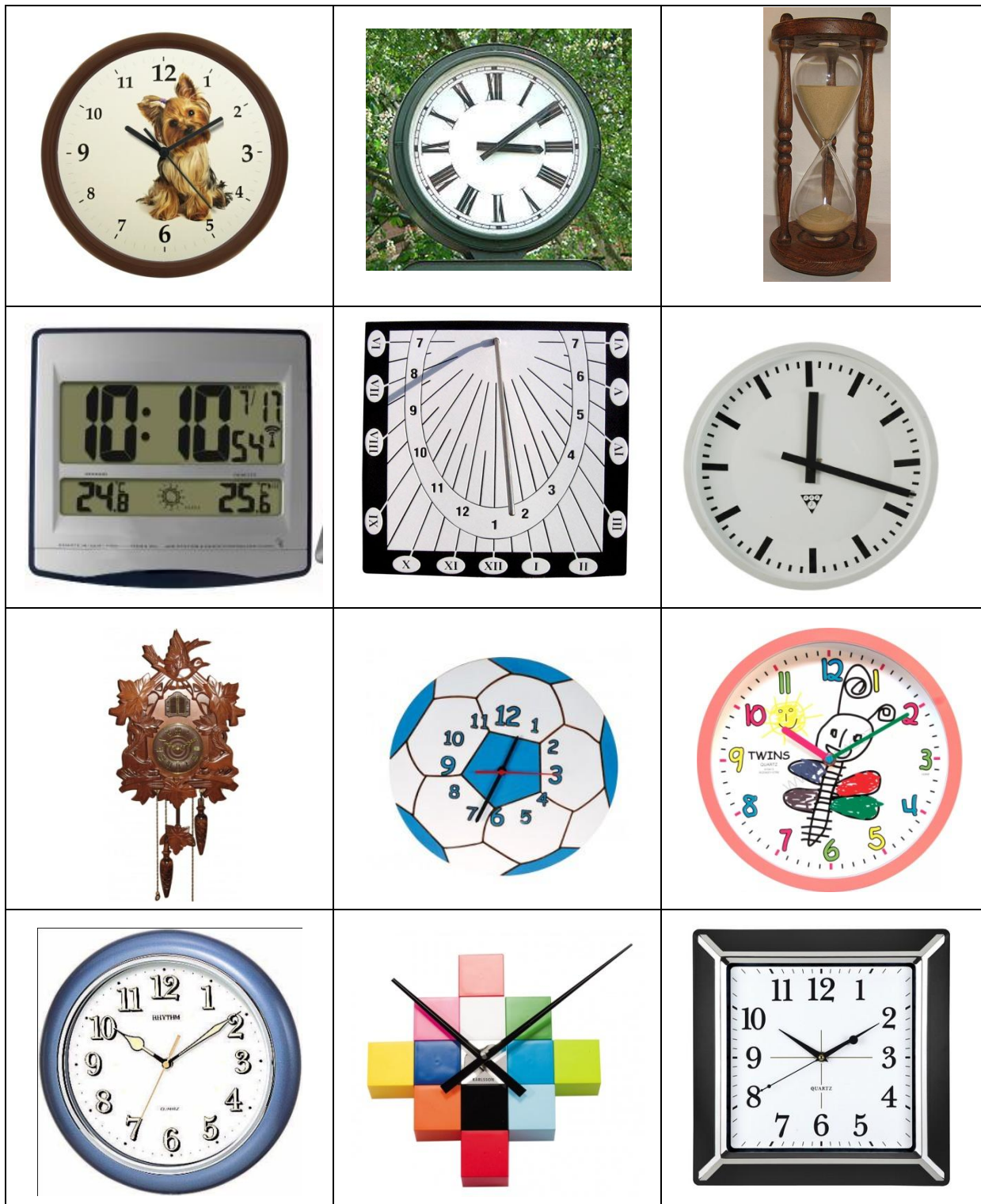
Příloha 1 - obrázky hodin