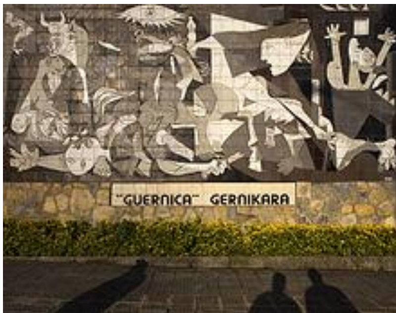
Malba na zdi