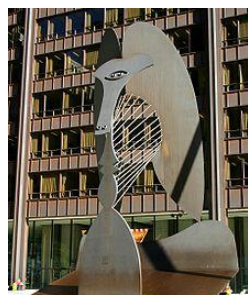
Skulptura v Chicagu

V 30. letech 20. století vystřídal harlekýna jako hlavní motiv Picassových obrazů minotaurus. To, že Picasso používal motiv minotaura, můžeme zčásti přičíst jeho kontaktu se surrealisty, kteří minotaura často používali jako svůj symbol. U Picassa ho můžeme najít např. v obraze Guernica. Je to jeden z jeho nejznámějších obrazů. Zobrazuje bombardování španělského města Guernica Němci. Dlouhou dobu bylo toto plátno v newyorském Muzeu moderního umění, v roce 1981 se vrátilo do Španělska a dnes je v Madridu.