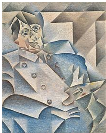
Portrét Pabla Picassa, který namaloval Juan Gris (1912)