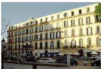
Dům v Málaze, ve kterém se Pablo Picasso narodil