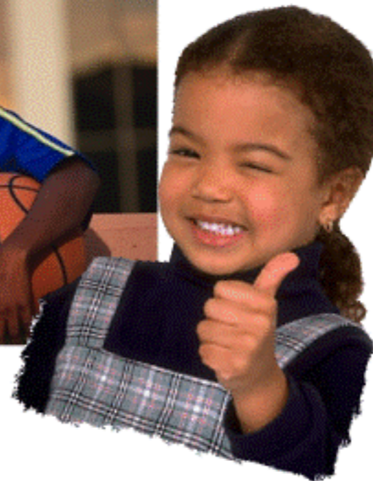
We are friends.