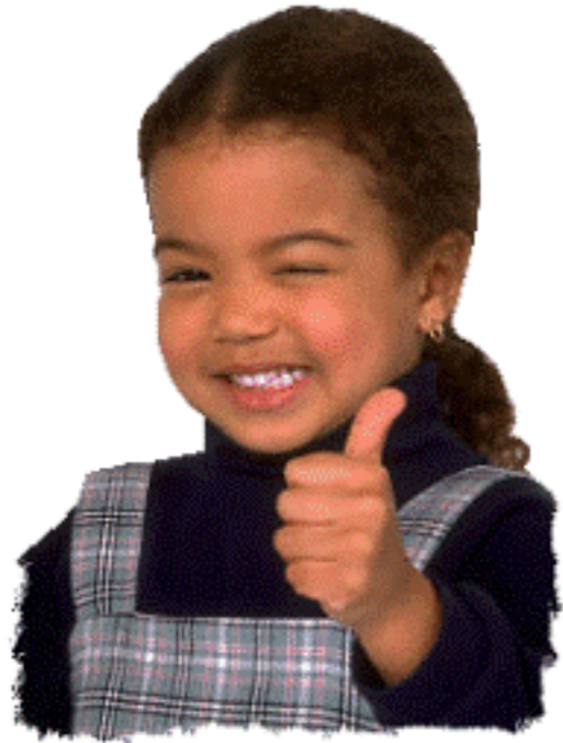
I am Eve.