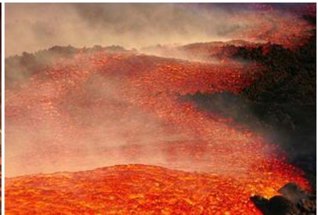
Teploty na mladé zemi dosahovaly takových hodnot, že se jednotlivé prvky začaly od sebe oddělovat.

Je tedy zřejmé, že srážky s jinými tělesy byly určující po celou dobu vzniku planety Země.